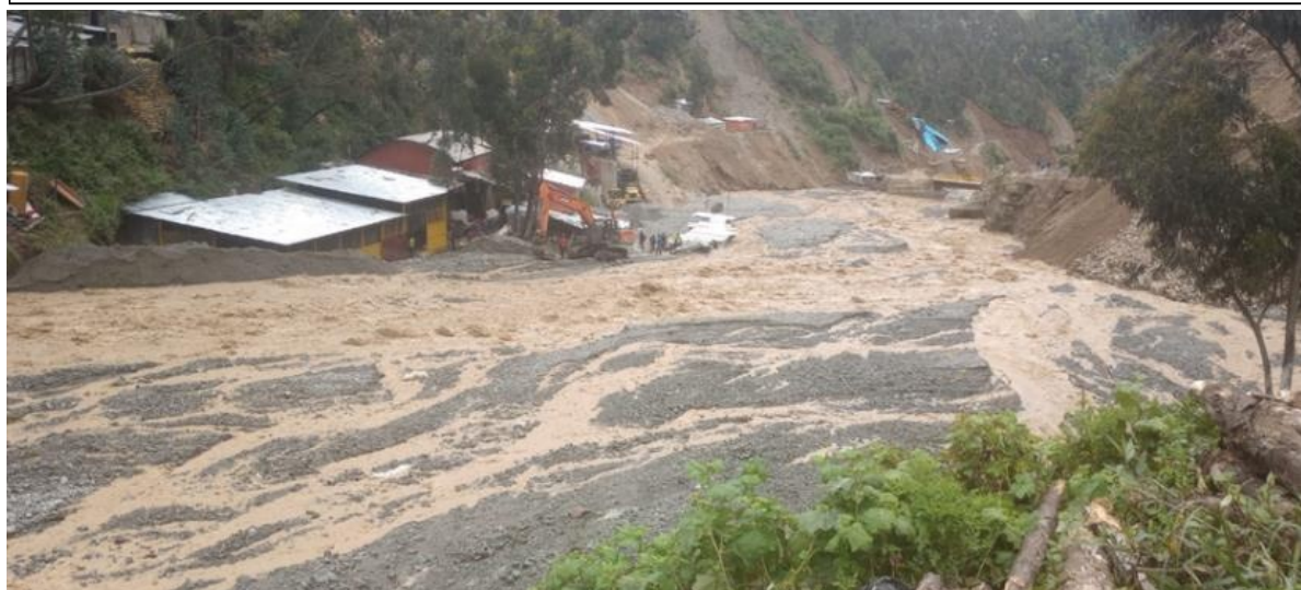
FIGURA N°02: EN EL RECORRIDO SE OBSERVA QUE EL RIO, EN SU MARGEN DERECHA E IZQUIERDA VIENE AFECTADO PARTE DE LA CARRETERA TOTALMENTE DESTRUIDA