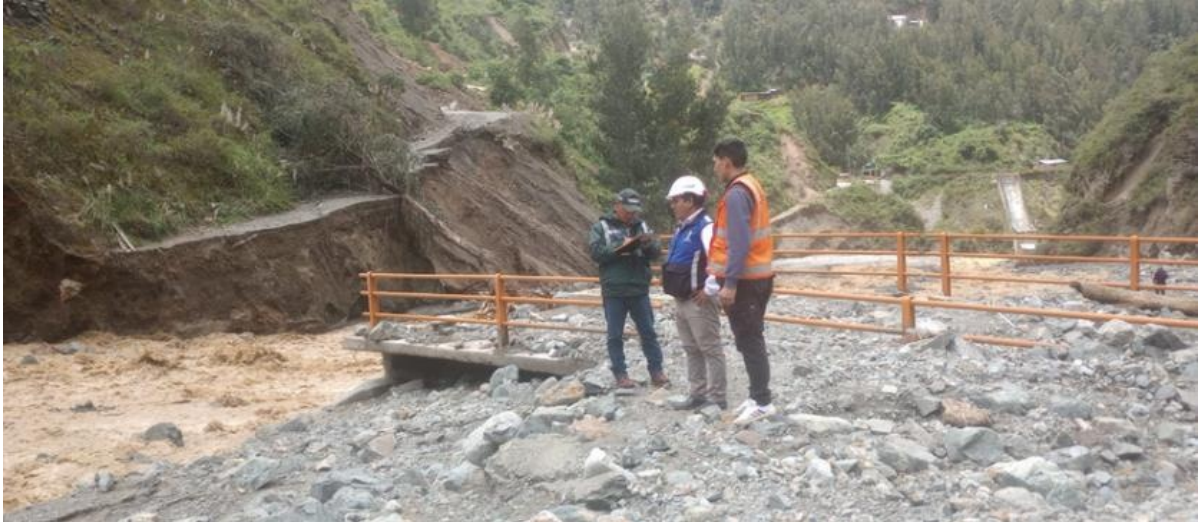
FIGURA N°03: EN EL FINAL DEL TRAMO DE LA QUEBRADA HA AFECTADO A LAS VIVIENDAS, PUENTE Y LA CARRETERA

Ministerio de Desarrollo Agrario y Riego