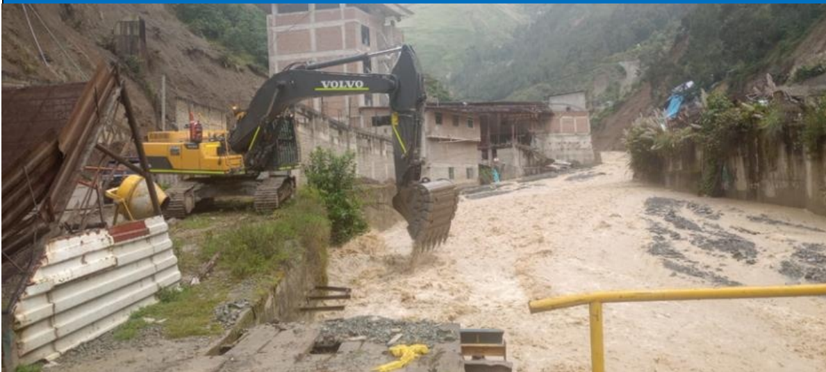
FIGURA N°01: RECORRIDO E IDENTIFICACION DE TRAMOS CRÍTICOS DESDE EL PUNTO DE INICIO, DONDE SE PUEDE VISUALIZAR QUE LA QUEBRADA EN SU MARGEN DERECHA E IZQUIERDA AFECTADO A VIVIENDAS Y PARTE DE LA CARRETERA DESTRUIDA.